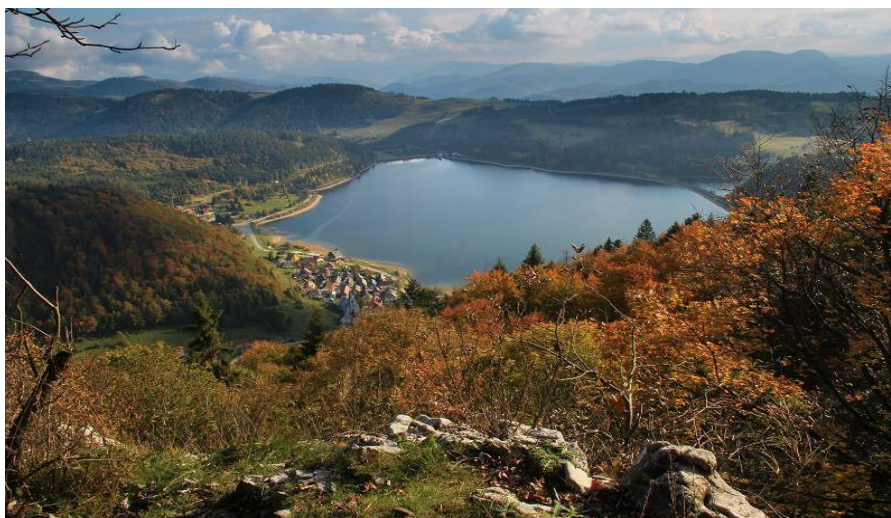
Gačovská skala - vyhládka

Penzión Erika -- Hotel Priehrada** -- Penzión Jozefína